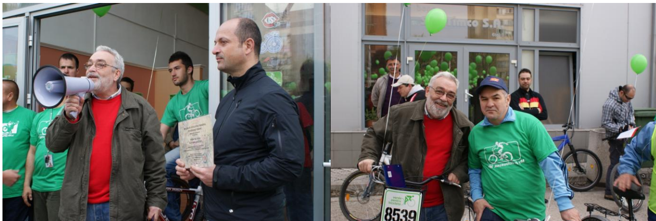
Imagine Emil Cristescu- Doroftei-Radu Radoslav

Evenimentul a fost continuat de un mars al biciclistilor, in scopul sustinerii constructiei de piste de biciclete in Municipiul Timisoara.