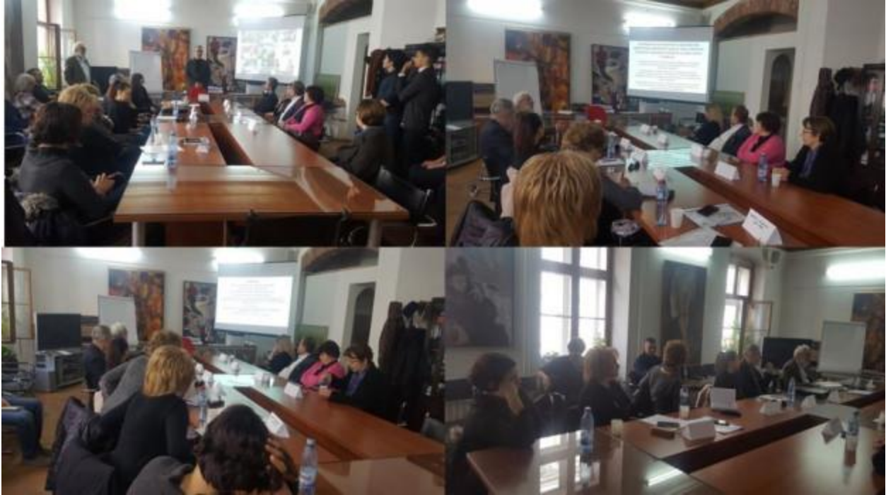
fig.1 – imagini din timpul dezbaterilor.

Temele propuse dezbaterii au fost: “Delimitarea zonei pe care se întocmește un PUZ” (pe zone și nu pe parcele), “Spațiul verde în dezvoltările imobiliare rezidențiale” (comasarea acestora în spații publice mari și nu disiparea lor în parcele private mici) și “Echiparea obligatorie cu rețele edilitare a dezvoltărilor imobiliare rezidențiale” (conexiunea acestora la rețele existente prin culoare proprietate publică). Din studiile de caz pozitive prezentate remarcăm propunerea unui PUZ, Calea Torontalului, Timișoara care este întocmit pe o zonă formată din mai multe tarlale agricole actuale, ce urmează a fi urbanizate (fig.2), care a comasat spațiile verzi pe lângă pârîul Beregsău (formînd un culoar ecologic verde-albastru proprietate publică, de lățime de peste 50m ce se prelungește pe întregul său traseu), un teren proprietate publică pentru facilitatea de învățămînt necesară întregii Unități Teritoriale de Referință (UTR) și dezvoltare rezidențială care are asigurată conectivitatea rețelelor edilitare pe culoare propuse a fi proprietate publică la cele existente de pe Calea Torontalului.