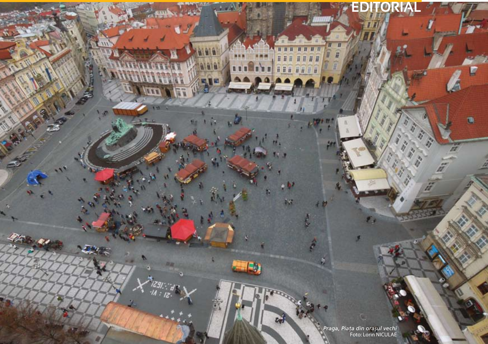
Praga, Piața din orașul vechi

pe câmp și înlocuind recolta agrară cu profitul tranzacțional. Traversând criza din 2008, studiul autorilor se oprește asupra alternativelor prin care orașul poate fi luat în posesie din punct de vedere uman și la scara omului, utilizând rețelele de socializare fizice și virtuale. Proiectele Fabrica de pensule și Turnul nostru sunt două exemple elocvente de recuperare urbană citate în articol.